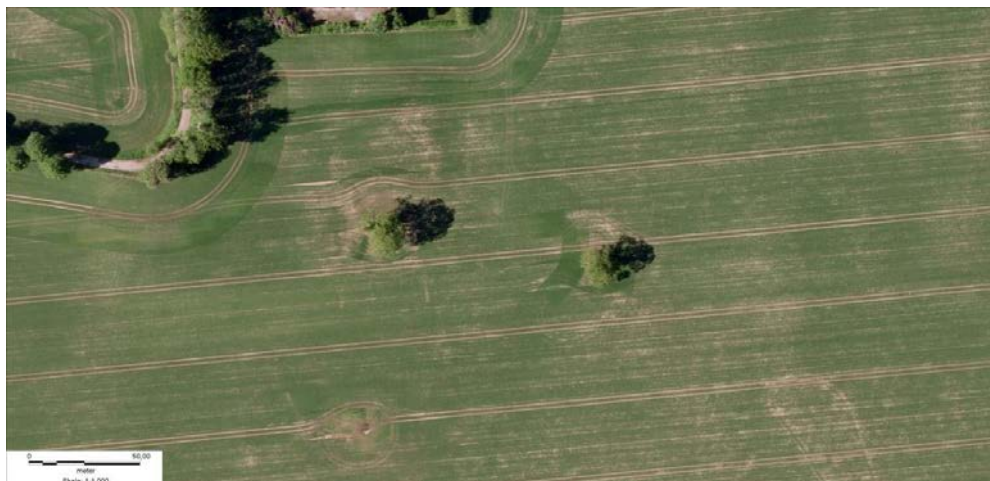
To solitærtræer som stort set indgår uhindret i de anlagte faste kørespor anvendt i forbindelse med markarbejdet