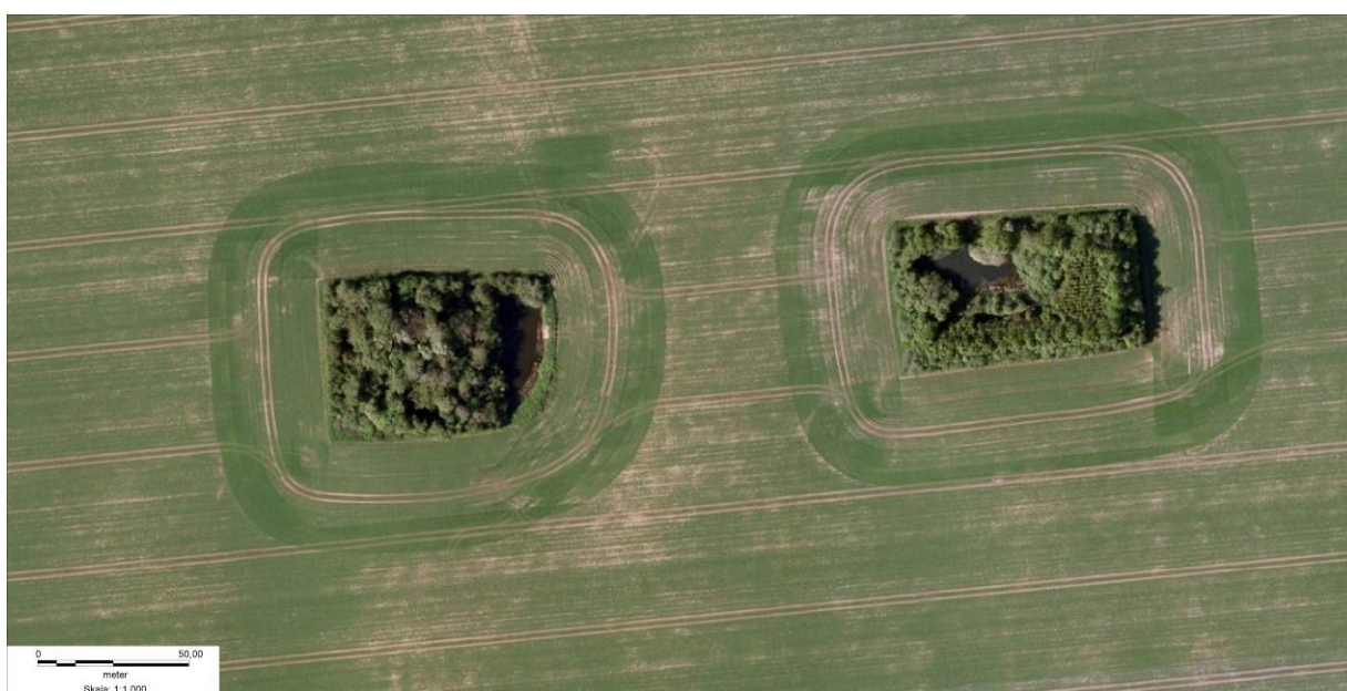
To adskilte remisser som indgår i markdriftens mønster af faste kørespor