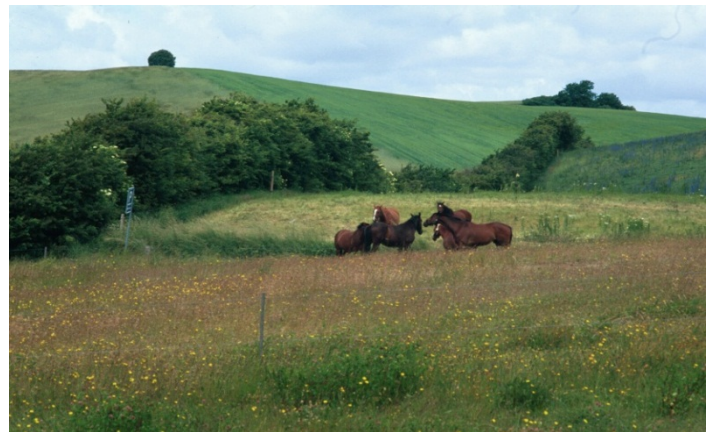
Et eksempel på hvordan solitærtræer, remisser og hegnsbepantninger er uundværlige elementer, som er med til at forstærke den landskabelige oplevelse

I forhold til Enkeltbetalingen skal man være opmærksom på, at de støtteberettigede arealer, herunder græsarealer, holdes fri for træer og buske. Der må dog være op til 50 spredte træer pr. hektar. Klynger af træer skal trækkes fra, da de ikke kan medregnes i det støtte-