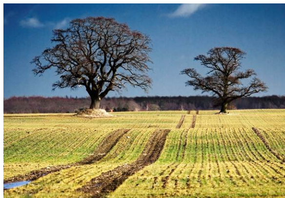
Foto B De samme solitærtræer fra en lidt anden vinkel, tidligt forår