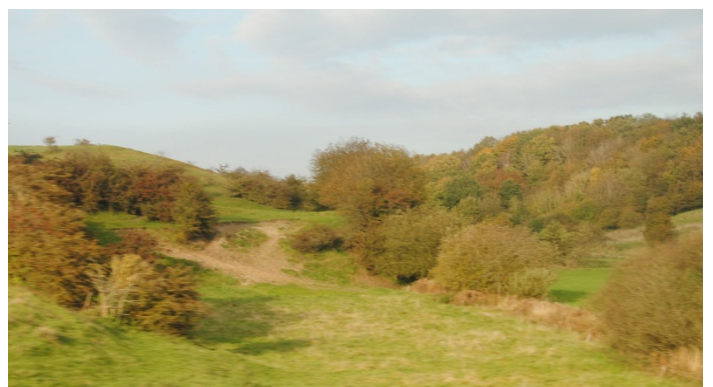
Terrænform sløret af tiltagende træbevoksning