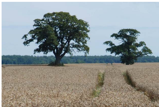
Foto A Solitærtræer i hvedemark med faste kørespor