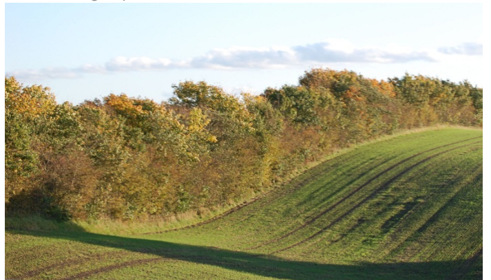
Terrænform fremhævet med træække