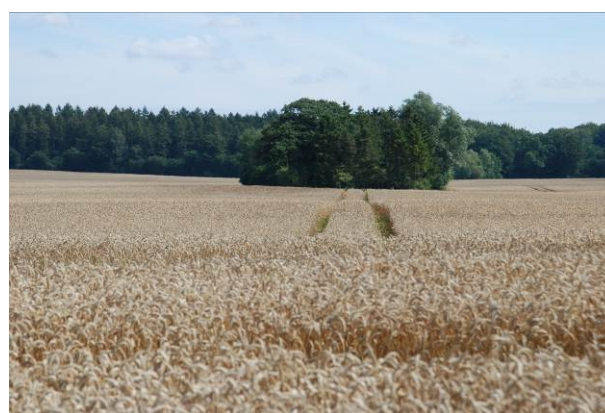
Foto D Fast kørespor med retning lige imod remisserne, men som uden de store gener og omkostninger svinger rundt om remisserne